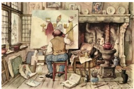
Laliquemuseum Doesburg