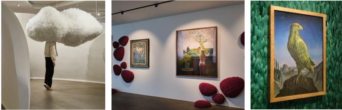
Peter de Cupere, Frits van den Berghe en Jenny Montigny en Jane Graverol

De kunstwerken - waardoor de bezoeker ook in wolken zweeft of in de verbeelding verder reist- zijn soms in een passend en verrassend kader bij elkaar gebracht, met opgehangen sinaasappelen, witte veren etc.